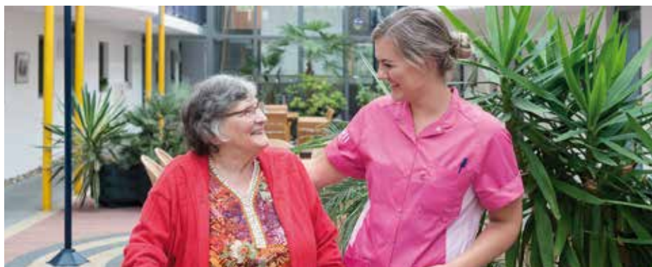
ARCHIEFFOTO - Op de foto staat niet mevrouw Valk

Thuiszorg Samen, T: 088- 6194100 www.woonzorggroepsamen.nl