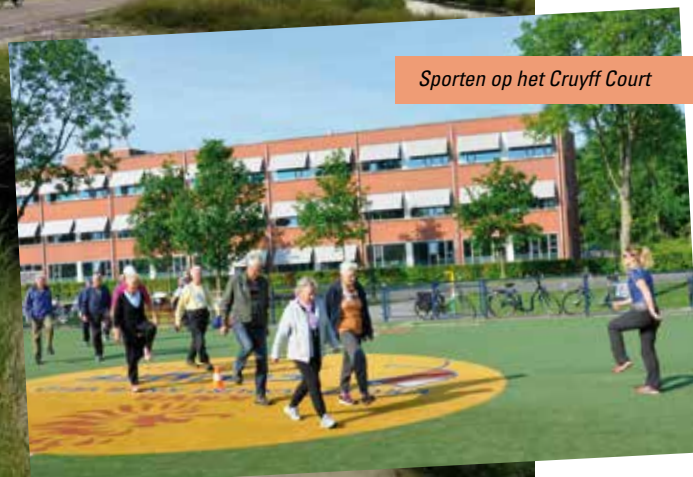
Sporten op het Cruyff Court