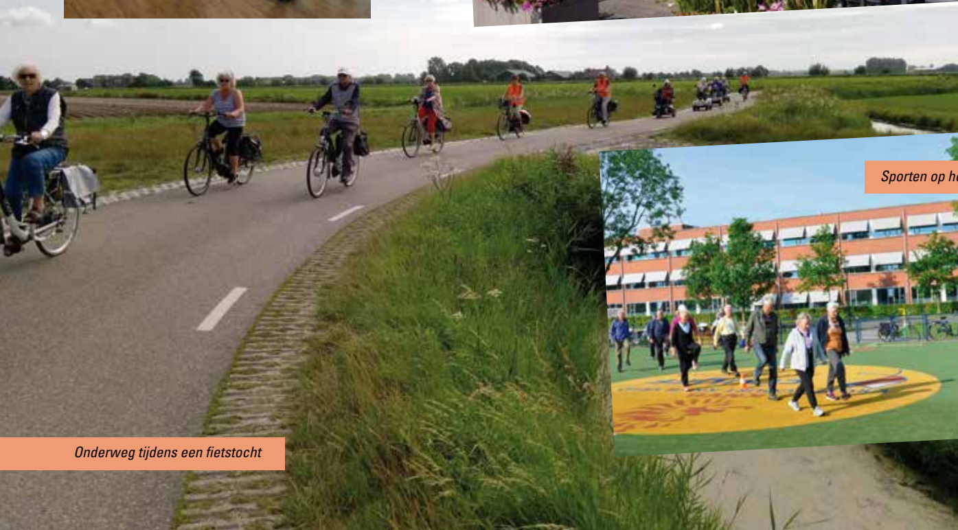
Onderweg tijdens een fietstocht