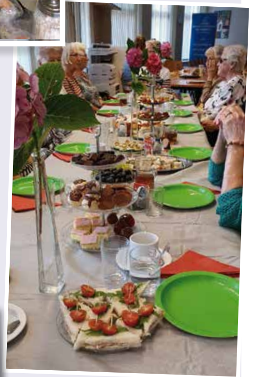
De ambtenaren van de gemeente Hollands Kroon zetten zich belangeloos in tijdens de HKDoet. Zij hebben een fantastische high tea verzorgd voor de bezoekers van de Doet & Ontmoet-groepen.