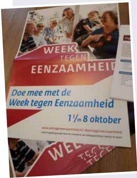
Doet & Ontmoet besteedt aandacht aan de Week van de Eenzaamheid