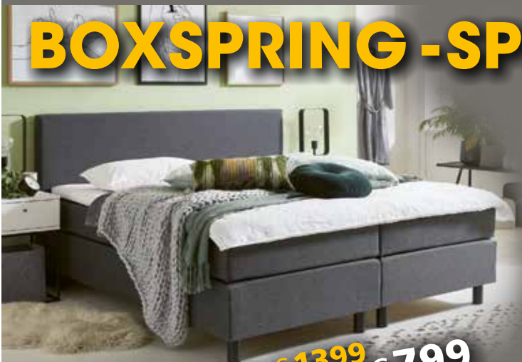
Boxspring V620 incl. topper