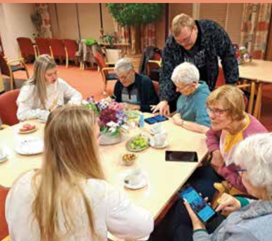
Een van de tafels waaraan hard werd gewerkt

Deze digitale bijeenkomsten staan in het teken van leuke, interessante gesprekken en ontmoetingen, maar vooral van ontspanning en gezelligheid. Alles wat u nodig heeft is een tablet of laptop, een tablet kunt u ook in bruikleen krijgen. Dan ontmoeten we elkaar via Skype. Wilt u meer informatie of aanmelden dan kan dat telefonisch 0224-273140 of per mail naar info@wonenpluswelzijn.nl .