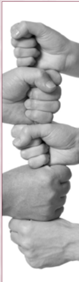
ontwerp: grafisch centrum eelan