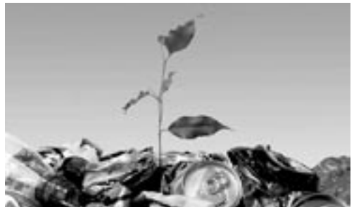
wandelen in schagen of een bezoek aan de huisvuilcentrale