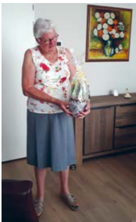
Paaspresentjes bij de Horst

N u deelnemers door corona de activiteiten niet kunnen bezoeken, zijn initiatieven meer dan welkom. Van tulpenacties, kaartjes, telefoontjes naar deelnemers, contact via whatsappgroepen tot telefooncirkels. De vrijwilligers en begeleiders van de activiteitengroepen van WPW bedenken veel creatieve manieren om met elkaar in contact te blijven.