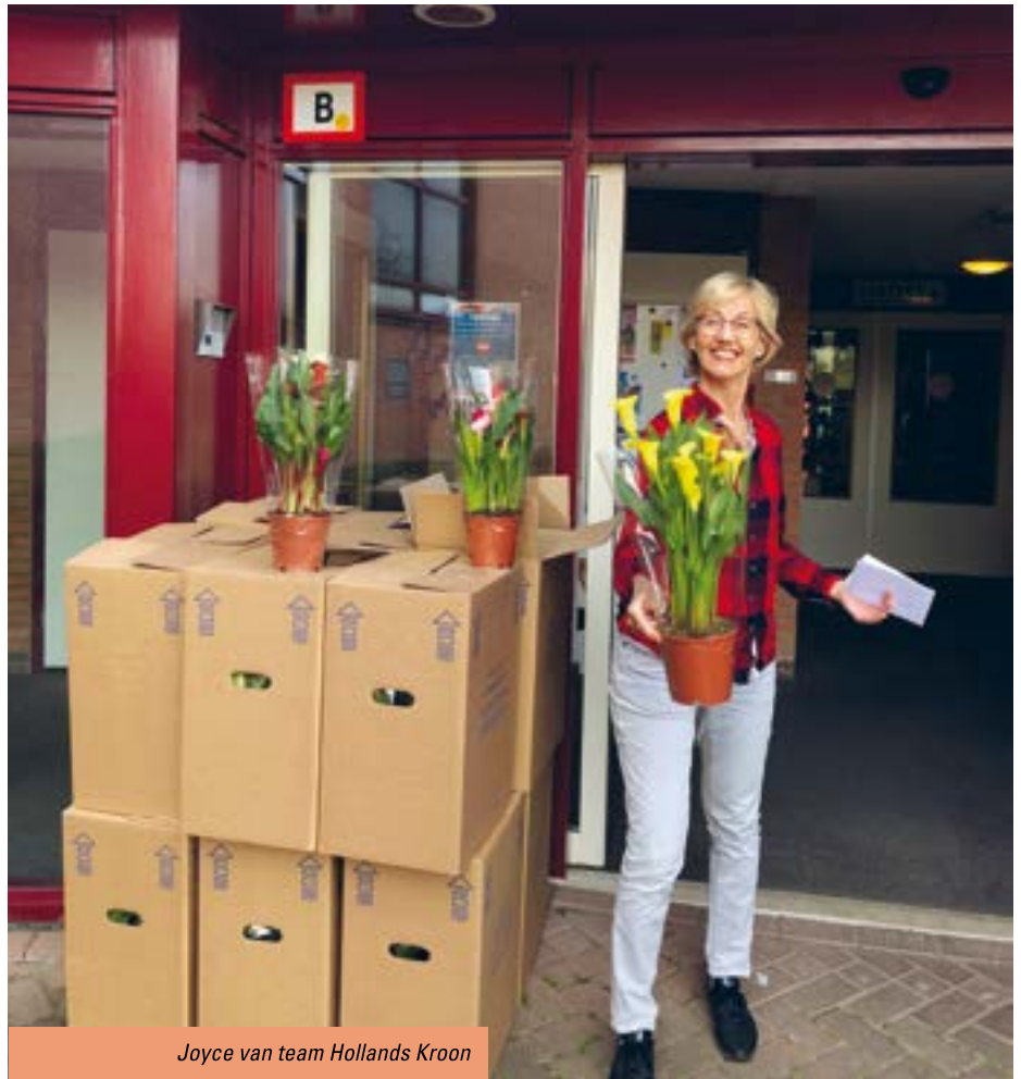
Joyce van team Hollands Kroon

De deelnemers waren blij en verast met dit gebaar en vonden het fijn om een vrijwilliger of beroepskracht te zien en te spreken. Ook de vrijwilligers en beroepskrachten gaf het een goed gevoel de bezoekers te kunnen verrassen en te spreken. Op de foto's is dit te zien! De Calla's komen uit Bleijswijk. Wij zijn blij met de firma Teeuwen uit Breezand die ze heeft opgehaald en naar het Servicepunt in Anna Paulowna heeft gebracht.