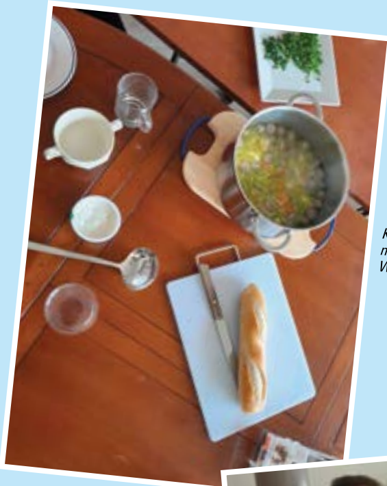
Kom ook op maandag naar het lunchcafé in Wieringerwaard.