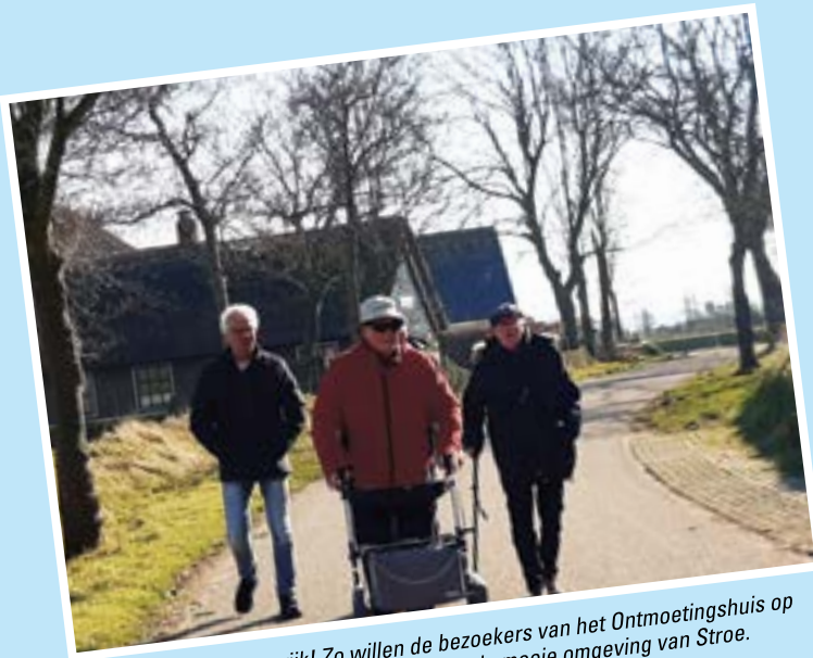
Bewegen is belangrijk! Zo willen de bezoekers van het Ontmoetingshuis op Wieringen er graag actief op uit in de mooie omgeving van Stroe.