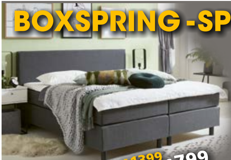
Boxspring V620 incl. topper