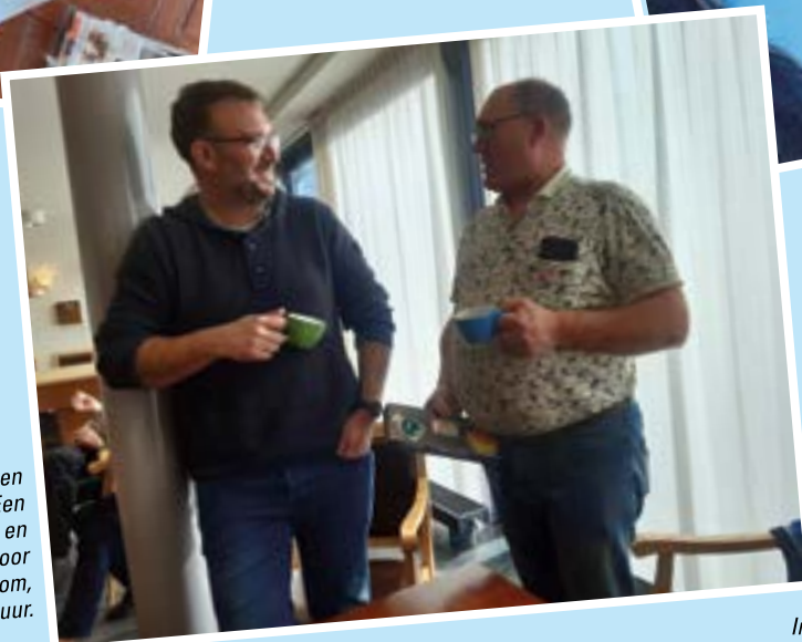
In de Doorbraak in Kreileroord is een gloednieuwe Doet & Ontmoet gestart! Een gezellige ruimte waar de koffie pruttelt en fijne gesprekken gevoerd worden door jong en oud. Iedereen is van harte welkom, elke woensdag van 9.30 tot 11.30 uur.

Informatie of deelname, bel met het Servicepunt.